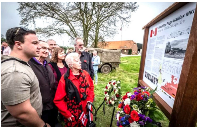
Familieleden bij het informatie bord

In Canada wordt niet meer gesproken over de vijf vliegeniers die 81 jaar geleden sneuvelden in een bos in Vierlingsbeek. Nu is er op de crashsite een informatiebord voor de bemanning van de Halifax II DT808. Vijf bemanningsleden verloren hier leven, twee wisten zich te redden.