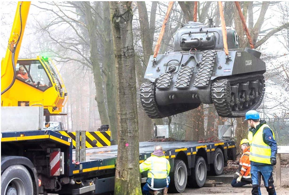
Het weghalen in januari 2022.

Terwijl de standplaats van de tank vernieuwd werd, kreeg hij zelf ook een opfrisbeurt. In Delft is hij helemaal schoongemaakt en kreeg een grote onderhoudsbeurt. Binnenkort is de tank dus fris en schoon weer in vol ornaat te bewonderen.