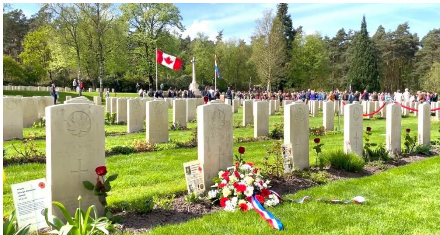
Still uit video van JS Fotografie