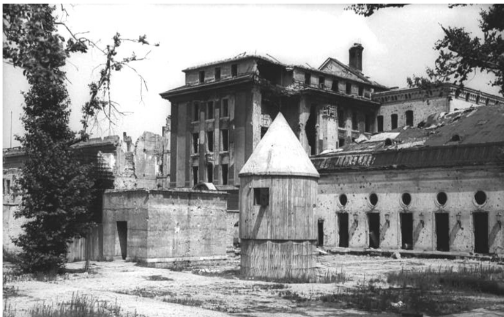
Achterzijde met nooduitgang Führerbunker

Adolf Hitler pleegt om 15:30 uur, samen met zijn vrouw Eva Braun, zelfmoord in de zogenaamde ' Führerbunker '.